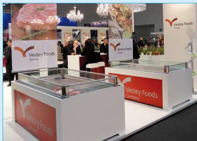
Tiefkühlinsel, Art.-Nr.: 1207